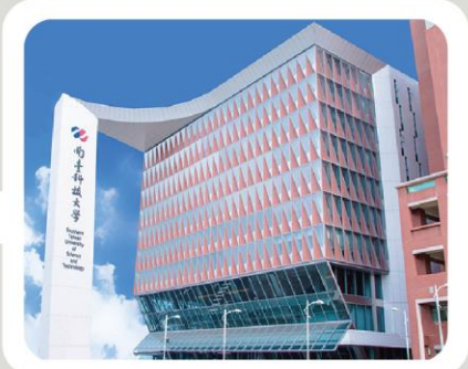
▲ 南臺科技大學大門照