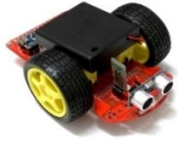
<小阿丟輪型機器人>